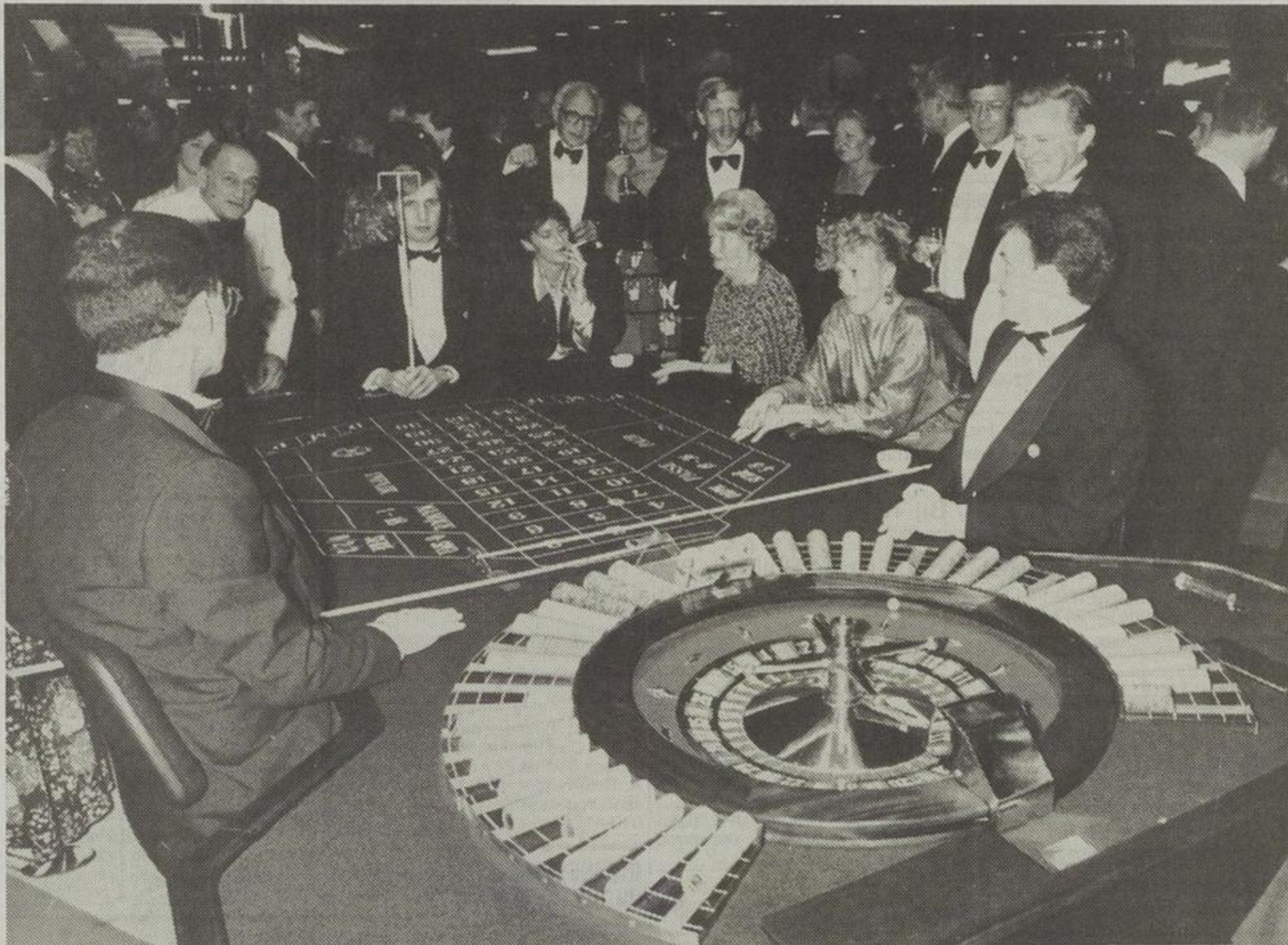
De roulette in het Rotterdamse casino: gokkers in de ban van het rollende balletje.

Niettemin zouden voorfinancieringen de organisaties en bedrijven geen winderen leggen. De Nederlandse Midden-